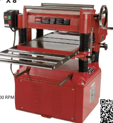
KN CM-20CS1 / 11261 CEPILLADORA PARA MADERA 20" X 8"