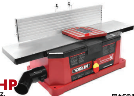
KN CM-11MA / 13100 CANTEADORA DE BANCO 6"